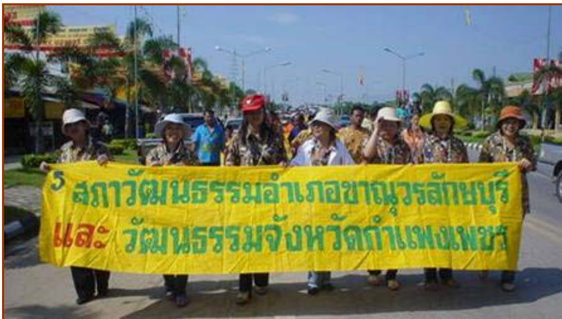
รูปแบบของเครือข่าย/องค์กรวัฒนธรรม

3.3.4 จัดทำและเชื่อมโยงฐานข้อมูลระหว่างเครือข่ายด้านศาสนา ศิลปะ วัฒนธรรม จารีตประเพณีและภูมิปัญญาท้องถิ่น เพื่อถ่ายทอดองค์ความรู้ และประสบการณ์ซึ่งข้อมูลดังกล่าว องค์การปกครองส่วนท้องถิ่น ได้มีการจัดเก็บรวบรวมเพื่อประกอบการจัดทำแผนพัฒนาท้องถิ่นอยู่แล้ว