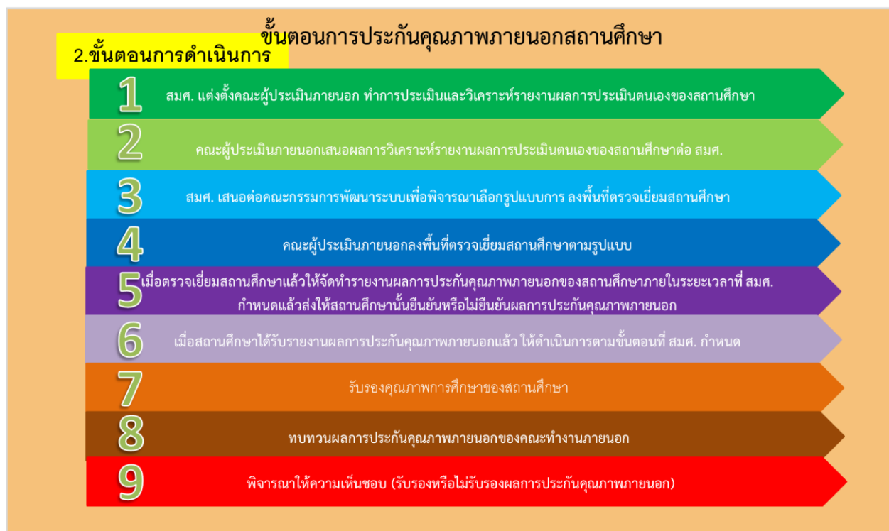
ภาพที่ 4 แสดงขั้นตอนการประกันคุณภาพภายนอกสถานศึกษาขั้นตอนการดำเนินงาน