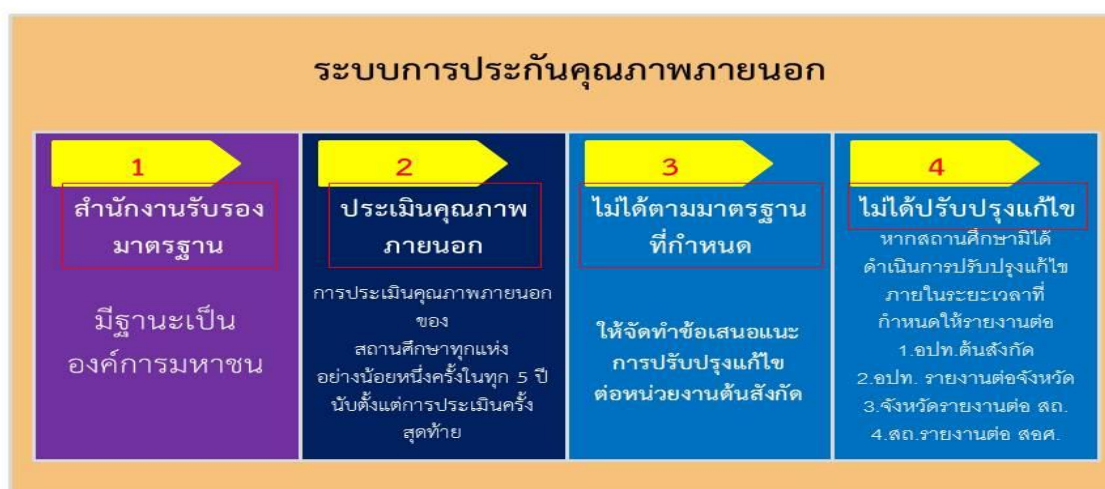
ภาพที่ 2 แสดงระบบการประกันคุณภาพภายนอก