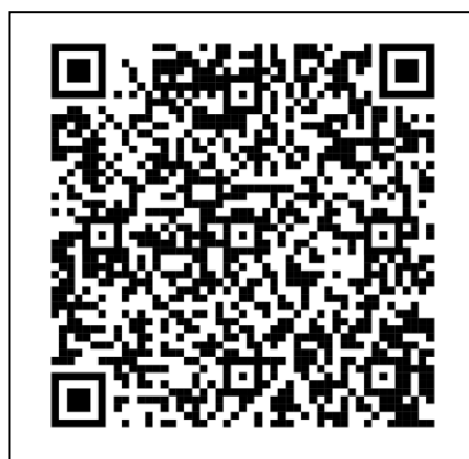
คิวอาร์โค้ด เพื่อเข้าห้องประชุม zoom

หมายเหตุ สำหรับผู้เข้าร่วมโครงการสัมมนาเชิงปฏิบัติการการเข้าใช้งานระบบบริหารมาตรฐานวิทยฐานะข้าราชการหรือพนักงานครู และบุคลากรทางการศึกษาองค์กรปกครองส่วนท้องถิ่น ระยะที่ ๑ เป็นผู้ที่ยังไม่รายงานตามหนังสือสำนักงาน ก.จ. ก.ท. และ ก.อบต. ที่ มท ๐๘๐๙.๔/ว ๓๙ ลงวันที่ ๒๙ พฤศจิกายน ๒๕๖๗