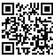
(ไฟล์ Excel แบบรายงาน)