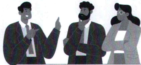
หลักสูตร Smart City (หลักสูตรต่อยอด)