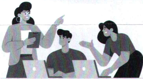
หลักสูตร Smart City