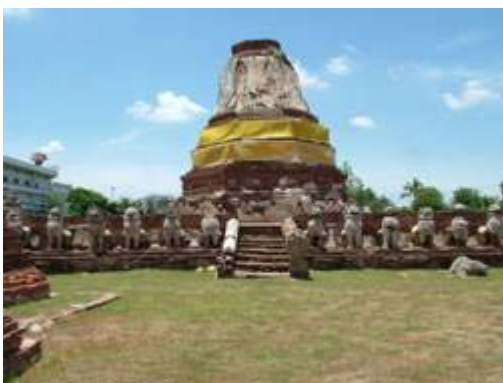
เจดีย์วัดธรรมิกราช จ.พระนครศรีอยุธยา ตัวอย่าง โบราณสถานที่สร้างด้วยอิฐ