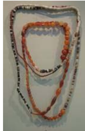
ลูกปัดทำด้วยหิน พบที่แหล่ง โบราณคดีคอนคาเพชร จ.กาญจนบุรี

ดังนั้นการแบ่งประเภทของโบราณวัตถุจึงไม่ได้กำหนดตายตัว ขึ้นอยู่กับความสะดวกในการแยกแยะจัดกลุ่มโบราณวัตถุในแต่ละแห่ง