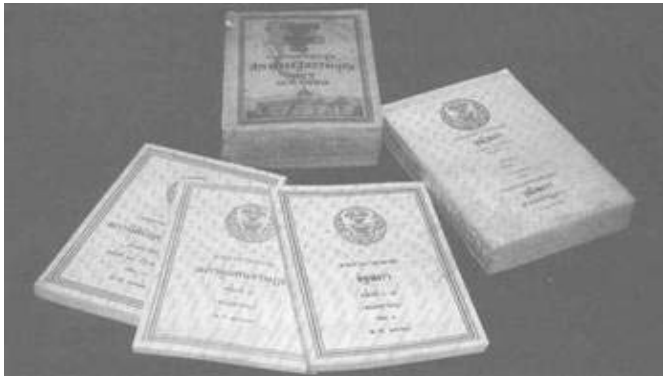
เอกสารการประชุม

(1.1) เอกสารจดหมายเหตุประเภทลายลักษณ์อักษร คือ เอกสารที่สื่อข้อความ เป็นลายลักษณ์อักษร ไม่ว่าจะเขียนด้วยมือหรือพิมพ์ลงบนวัสดุรูปแบบต่างๆ เช่น ใบบอกสารตรา หนังสือโต้ตอบ เอกสารการประชุม เป็นต้น