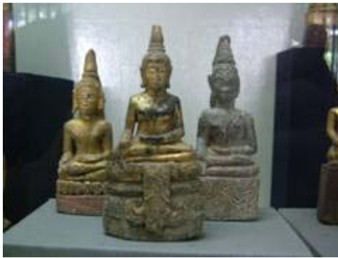
พระพุทธรูปไม้ พบในเขตจังหวัดน่าน