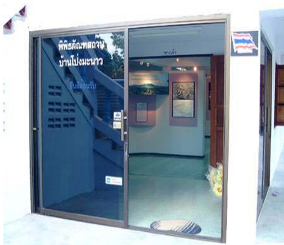
พิพิธภัณฑสถานชุมชนบ้านโป่งมะนาว ตำบลห้วยขุนราม อำเภอพัฒนานิคม จังหวัดลพบุรี เป็นตัวอย่างหนึ่งของพิพิธภัณฑสถานท้องถิ่น

(2) พิพิธภัณฑสถานสำหรับท้องถิ่น หมายถึง สถานที่ที่เก็บรักษา โบราณวัตถุ ศิลปวัตถุ เช่นกันแต่เน้นเป้าหมายหลักคือ จัดแสดงสิ่งของต่างๆ อันเป็นหลักฐานที่เกี่ยวข้องกับ มนุษย์และสิ่งแวดล้อมของมนุษย์ในท้องถิ่นนั้นๆ เพื่อให้คนในท้องถิ่น ได้รู้จักตนเองมากขึ้น เป็นแหล่งการเรียนรู้ตลอดชีวิตของผู้คนในชุมชนนั้น โดยเฉพาะอย่างยิ่งเพื่อเป็นแหล่งเรียนรู้ของเยาวชนที่จะเจริญเติบโตขึ้นมาในภายภาคหน้า พิพิธภัณฑสถานท้องถิ่นจึงเปรียบเสมือนสถานที่ที่สามารถเล่าประวัติความเป็นมาของผู้คนในชุมชนนั้น ได้อย่างชัดเจน ตั้งแต่อดีต จนถึงปัจจุบัน และอาจรวมถึงแนวโน้มที่จะเป็นในอนาคตด้วย เรื่องราวในพิพิธภัณฑสถานประจำท้องถิ่นใดท้องถิ่นหนึ่ง ก็ควรจะต้องสัมพันธ์กับเรื่องราวประวัติศาสตร์ทางวัฒนธรรม ประวัติศาสตร์สังคม และชีวิตความเป็นอยู่ของผู้คนในท้องถิ่นนั้น หรือกล่าวง่ายๆ ก็คือ เนื้อหาในการจัดแสดงสิ่งของในพิพิธภัณฑสถานประจำท้องถิ่น ควรจะต้องแสดงให้เห็นถึงเอกลักษณ์ของท้องถิ่นนั้น