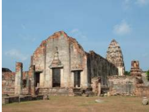
วัดพระศรีรัตนมหาธาตุ จ.ลพบุรี ซึ่งไม่ได้เป็นวัดของสมัยปัจจุบันแล้ว

4.2 โบราณสถานที่ยังใช้ประโยชน์ (Living Monument) เป็นโบราณสถานที่ยังคงมีการใช้ประโยชน์ตามหน้าที่ดั้งเดิมจนถึงทุกวันนี้ เช่น โบสถ์ วิหาร เจดีย์ ป้อมปราการ หรือคูคลอง เป็นต้น