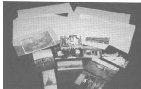
สไลด์เหตุการณ์สำคัญ

(1.3) เอกสารจดหมายเหตุประเภทแผนที่ แผนที่