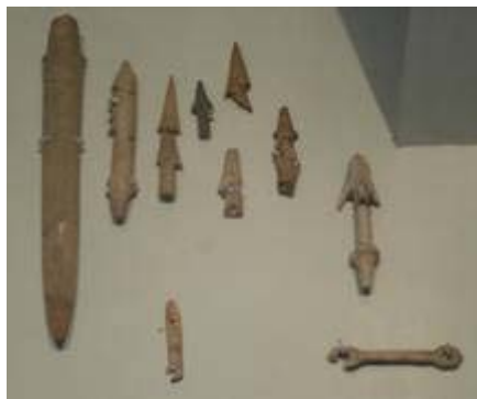
เครื่องมือล่าสัตว์ ทำด้วยกระดูกสัตว์ พบที่แหล่งโบราณคดีบ้านเก่า จ.กาญจนบุรี