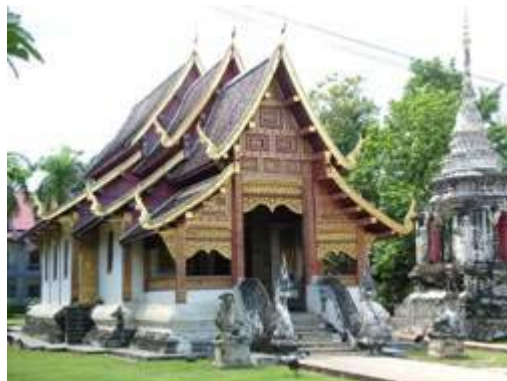
วิหารลายคำ วัดพระสิงห์ จ.เชียงใหม่ ตัวอย่างหนึ่งของโบราณสถาน ที่ยังใช้ประโยชน์เป็นวิหารของวัดในปัจจุบัน

4.2 โบราณสถานที่ยังใช้ประโยชน์ (Living Monument) เป็นโบราณสถานที่ยังคงมีการใช้ประโยชน์ตามหน้าที่ดั้งเดิมจนถึงทุกวันนี้ เช่น โบสถ์ วิหาร เจดีย์ ป้อมปราการ หรือคูคลอง เป็นต้น