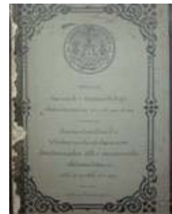
เอกสารที่เป็นลายลักษณ์อักษร

(1.2) เอกสารโสตทัศนจดหมายเหตุ คือ เอกสารที่สื่อโดยเสียงหรือภาพ เช่น ภาพถ่าย โปสเตอร์