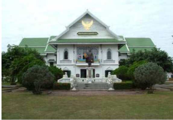
พิพิธภัณฑสถานแห่งชาติน่าน

(2) พิพิธภัณฑสถานสำหรับท้องถิ่น หมายถึง สถานที่ที่เก็บรักษา โบราณวัตถุ ศิลปวัตถุ เช่นกันแต่เน้นเป้าหมายหลักคือ จัดแสดงสิ่งของต่างๆ อันเป็นหลักฐานที่เกี่ยวข้องกับ มนุษย์และสิ่งแวดล้อมของมนุษย์ในท้องถิ่นนั้นๆ เพื่อให้คนในท้องถิ่น ได้รู้จักตนเองมากขึ้น เป็นแหล่งการเรียนรู้ตลอดชีวิตของผู้คนในชุมชนนั้น โดยเฉพาะอย่างยิ่งเพื่อเป็นแหล่งเรียนรู้ของเยาวชนที่จะเจริญเติบโตขึ้นมาในภายภาคหน้า พิพิธภัณฑสถานท้องถิ่นจึงเปรียบเสมือนสถานที่ที่สามารถเล่าประวัติความเป็นมาของผู้คนในชุมชนนั้น ได้อย่างชัดเจน ตั้งแต่อดีต จนถึงปัจจุบัน และอาจรวมถึงแนวโน้มที่จะเป็นในอนาคตด้วย เรื่องราวในพิพิธภัณฑสถานประจำท้องถิ่นใดท้องถิ่นหนึ่ง ก็ควรจะต้องสัมพันธ์กับเรื่องราวประวัติศาสตร์ทางวัฒนธรรม ประวัติศาสตร์สังคม และชีวิตความเป็นอยู่ของผู้คนในท้องถิ่นนั้น หรือกล่าวง่ายๆ ก็คือ เนื้อหาในการจัดแสดงสิ่งของในพิพิธภัณฑสถานประจำท้องถิ่น ควรจะต้องแสดงให้เห็นถึงเอกลักษณ์ของท้องถิ่นนั้น