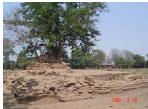
วัดปากส้วย เมืองกำแพงเพชร ภายหลังการขุดแต่ง