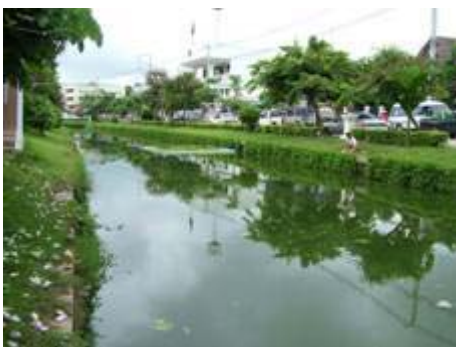
ภาพตัวอย่างคูเมืองลำพูน

- คูเมือง กำแพงเมืองโบราณ เป็นแนวเขตเมืองในสมัยโบราณที่ใช้ป้องกันบ้านเมือง ในขณะเดียวกันก็อาจใช้ประโยชน์ในการกักเก็บน้ำไว้ใช้ คูเมืองและกำแพงเมืองนี้ในสภาพปัจจุบันอาจเปลี่ยนสภาพไปแล้ว แต่เราสามารถเห็นร่องรอยได้อย่างชัดเจนในภาพถ่ายทางอากาศ