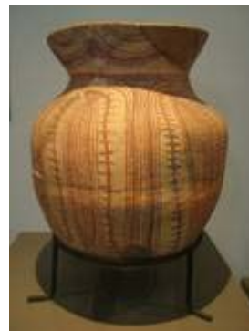
ภาชนะดินเผาลายเขียนสี พบที่แหล่งโบราณคดีบ้านเชียง จ.อุดรธานี