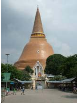
องค์พระปฐมเจดีย์ จังหวัดนครปฐม ตัวอย่างโบราณสถานที่เห็นรูปทรงชัดเจน

2.2 ซากโบราณสถาน หมายถึง สิ่งก่อสร้างหรือสถาปัตยกรรมที่เคยมีรูปทรงและใช้ประโยชน์มาแต่อดีต แต่ปัจจุบันได้เสื่อมสภาพลงจนไม่เห็นรูปทรงที่ชัดเจน แต่ยังมีคุณค่าในฐานะที่เป็นมรดกทางวัฒนธรรมที่สำคัญ ตัวอย่างเช่น