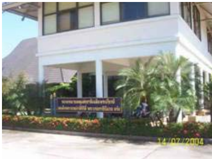
จดหมายเหตุแห่งชาติ จ.ตรัง

ในส่วนของท้องถิ่นนั้น ในขั้นต้นอาจยังไม่มีควมจำเป็นในการจัดตั้งจดหมายเหตุ เนื่องจากเอกสารจดหมายเหตุของท้องถิ่นนั้นๆ อาจดำเนินการจัดเก็บในพิพิธภัณฑ์ของท้องถิ่นได้