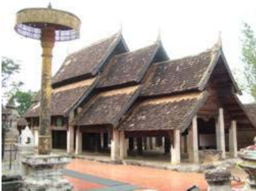
วิหารน้ำแต้ม วัดพระธาตุลำปางหลวง จ.ลำปาง ตัวอย่างโบราณสถานที่ยังคงสภาพดีด้วยไม้