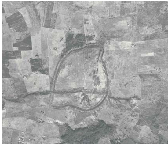
ตัวอย่างภาพถ่ายทางอากาศซึ่งเห็นร่องรอยคู้อมรอบเมืองโบราณชัยจำปา อำเภอกำแพงเพชร จังหวัดลพบุรี