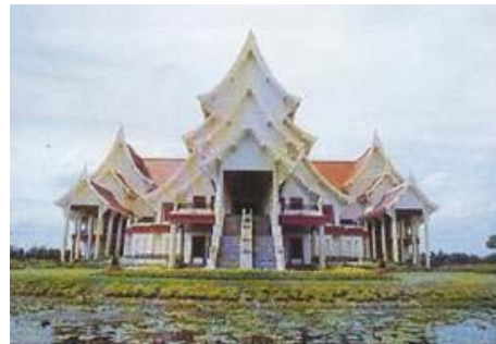
จดหมายเหตุแห่งชาติเฉลิมพระเกียรติ ลำลูกกา จ.ปทุมธานี