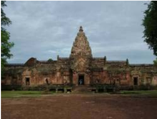
ปราสาทหินพนมรุ้ง จ.บุรีรัมย์ ตัวอย่างโบราณสถานที่ยังคงสภาพดีด้วยหินทราย