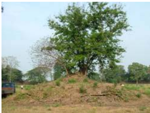
วัดปากส้วย เมืองกำแพงเพชร ก่อนการขุดแต่ง