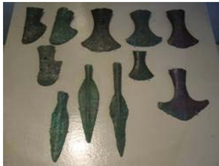
เครื่องมือทำด้วยโลหะสำริด พบที่แหล่งโบราณคดีบ้านเชียง จ.อุดรธานี