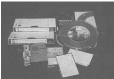
อัลบั้มภาพจดหมายเหตุ

(1.2) เอกสารโสตทัศนจดหมายเหตุ คือ เอกสารที่สื่อโดยเสียงหรือภาพ เช่น ภาพถ่าย โปสเตอร์