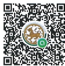
QR CODE กลุ่มไลน์ Open chat