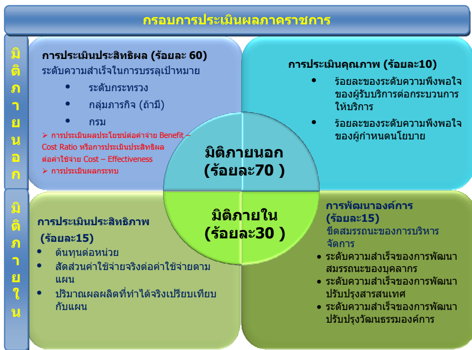
แผนภาพที่ 1 กรอบการประเมินผลการปฏิบัติราชการของส่วนราชการ

ระบบการประเมินผลภาครัฐราชการแบบบูรณาการนี้เป็นการบูรณาการการติดตามและประเมินผลของสำนักงานคณะกรรมการพัฒนาการเศรษฐกิจและสังคมแห่งชาติ สำนักงานปรมาณ กรรมบัญชีกลาง และสำนักงาน ก.พ.ร. เข้ามาอยู่ในระบบเดียวกัน โดยแบ่งออกเป็น 2 มิติ ดังแผนภาพที่ 1