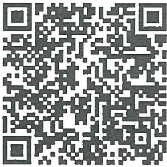
ระบบรายงานผลการดำเนินกิจกรรม “กองทุนแม่ของแผ่นดิน”