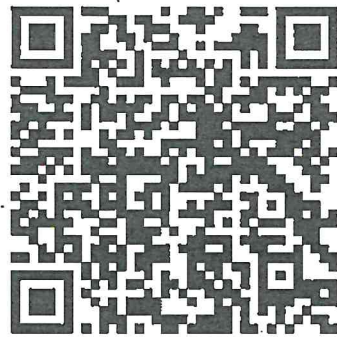
รูปแบบการตั้งโต๊ะหมู่ประดิษฐานพระบรมฉายาลักษณ์