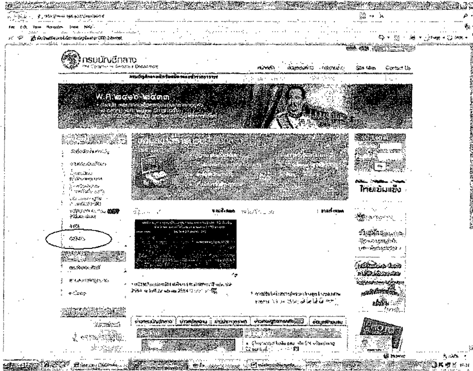
รูปภาพที่ ๑