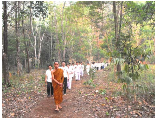
สนใจเข้าร่วมโครงการส่งเสริมคุณธรรมและจริยธรรม