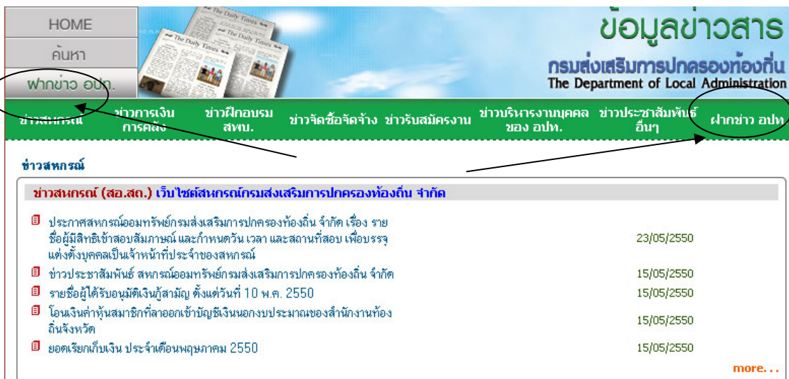
รูปที่ 2. แสดงการเข้าระบบฝากข่าว อปท. จากหน้าข้อมูลข่าวสาร

2. ผู้ฝากข่าวสามารถเข้าสู่ระบบฝากข่าวได้จากหน้าจอข้อมูลข่าวสาร โดยคลิกที่ข้อความดังรูปที่ 2.