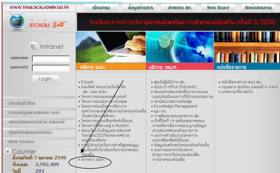
รูปที่ 1 . แสดงการเข้าระบบฝากข่าว อปท. จากหน้าหลัก

1. ผู้ฝากข่าวสามารถเข้าสู่ระบบฝากข่าว อปท. จากหน้าหลัก โดยการคลิกที่ข้อความฝากข่าว อปท. ดังรูปที่ 1.