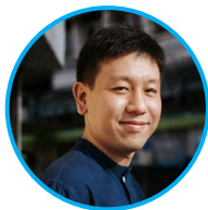
Mr. Sanon Wangrangboon Deputy Governor Bangkok Metropolitan Administration (BMA), Thailand