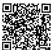
Line @ งานสัมมนา