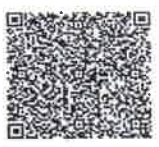
หน่วยงานเพาะชำกล้าไม้