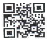
ลงทะเบียนปลูกต้นไม้