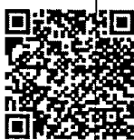
รายชื่อ รุ่นที่ ๖