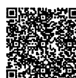
แบบฟอร์มจองห้องพัก