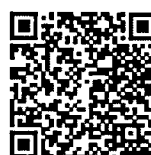
รายชื่อ รุ่นที่ ๑๓