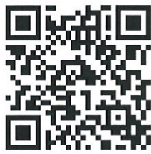
QR CODE แบบฟอร์มแสดงความประสงค์