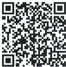
QR CODE คู่มือการรายงานตัวฯ

๕. หากมีข้อสงสัยหรือกรณีที่มีข้อจำกัดเกี่ยวกับอุปกรณ์และสัญญาณอินเทอร์เน็ต ให้แจ้งผ่านช่องทางกลุ่มงานสรรหา บรรจุแต่งตั้ง และข้อมูลบุคคล กองการเจ้าหน้าที่ กรมส่งเสริมการปกครองท้องถิ่น ถนนนครราชสีมา เขตดุสิต กรุงเทพฯ ๑๐๓๐๐ หรือติดต่อที่หมายเลขโทรศัพท์ ๐ ๒๒๔๑ ๙๐๐๐ ต่อ ๑๒๐๓ หมายเลขโทรสาร ๐๒ ๒๔๓ ๖๖๓๗ หรือ อีเมล DLA.HR.RECRUIT@gmail.com หรือ Facebook : “กลุ่มงานสรรหา บรรจุแต่งตั้ง และข้อมูลบุคคล กรมส่งเสริมการปกครองท้องถิ่น”