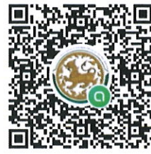
QR CODE กลุ่มไลน์ Open chat