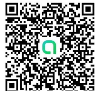
QR Code ครู ป.6