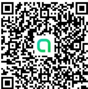
ครูปฐมวัย 2 ขวบ (อปท.)