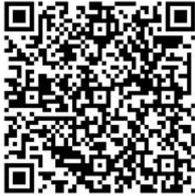
QR Code สมัครเป็นผู้ดูแลระบบ

1. QR Code สำหรับผู้สนใจสมัครเป็นผู้ดูแลระบบตามข้อ 1