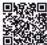
ประกันภัยทรัพย์สิน