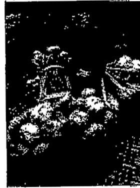
กระเทียมมัดजूก