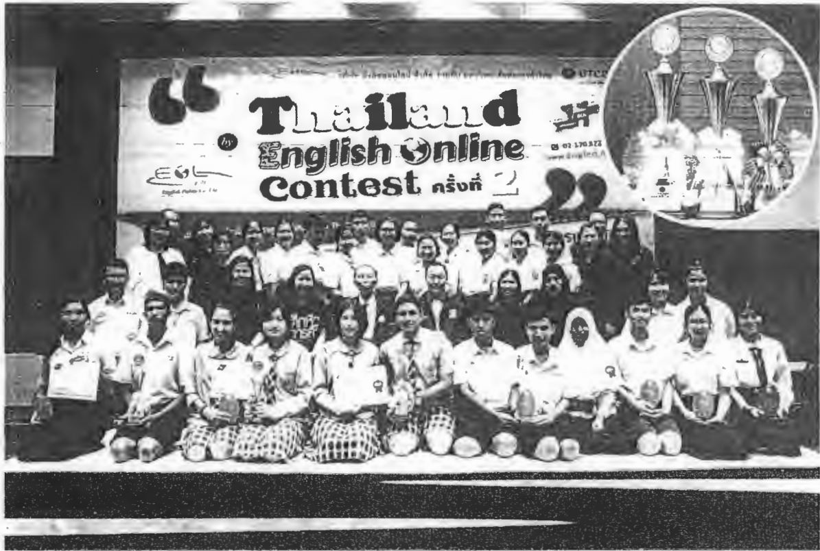
ภาพเหตุการณ์บางส่วนของการแข่งขันรอบชิงชนะเลิศ เมื่อวันที่ 11 กุมภาพันธ์ 2560 ณ มหาวิทยาลัยหอการค้าไทย