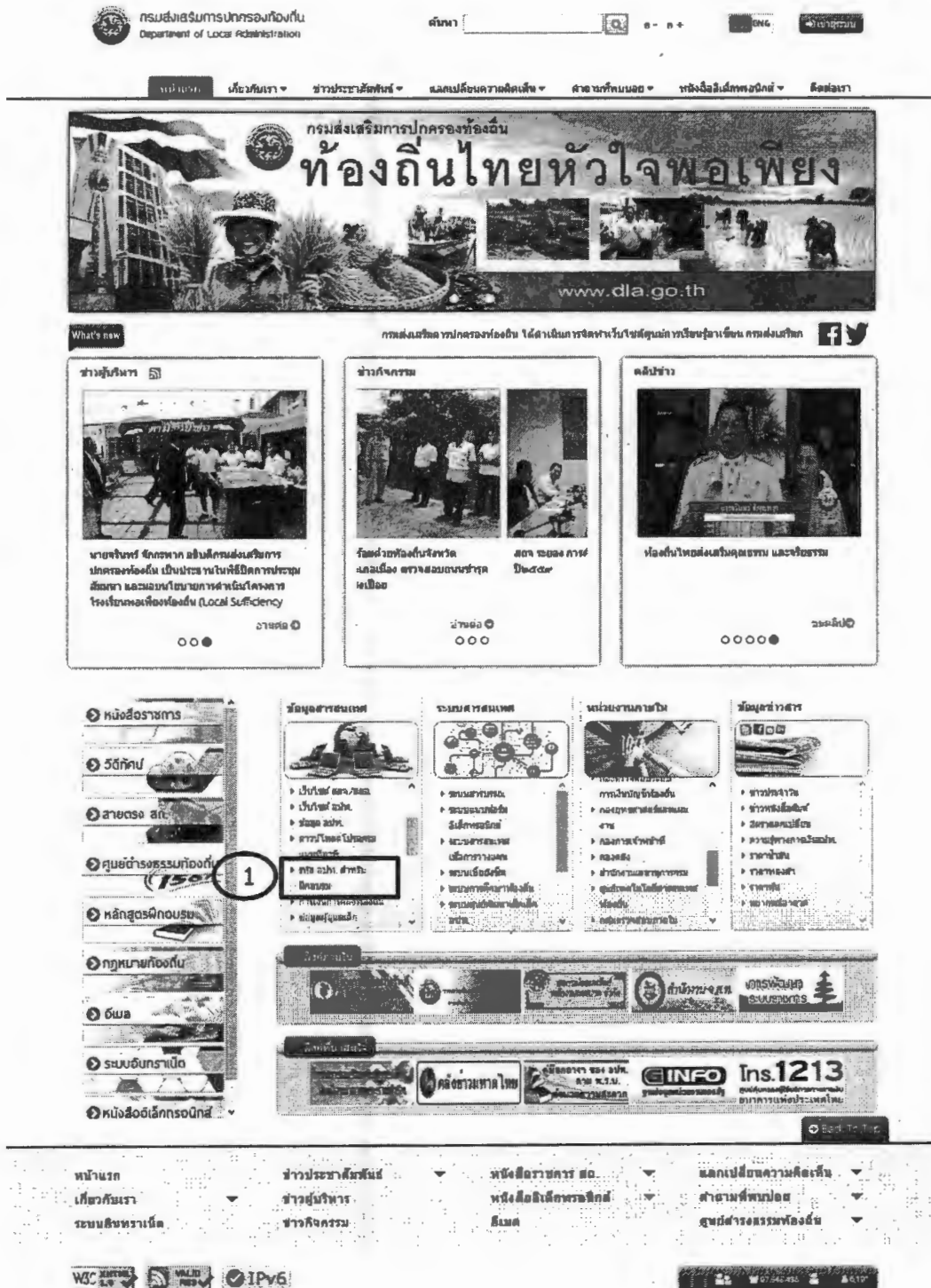
ภาพที่ 1 เว็บไซต์กรมส่งเสริมการปกครองท้องถิ่น

1. เปิดโปรแกรม Web Browser (Google Chrome, Firefox) จากนั้นพิมพ์ URL http://www.dla.go.th เพื่อเข้าสู่เว็บไซต์กรมส่งเสริมการปกครองท้องถิ่น แล้วคลิกเลือกเมนู “รหัส อปท. สำหรับฝึกอบรม” จากหัวข้อ “ข้อมูลสารสนเทศ” ตามภาพที่ 1