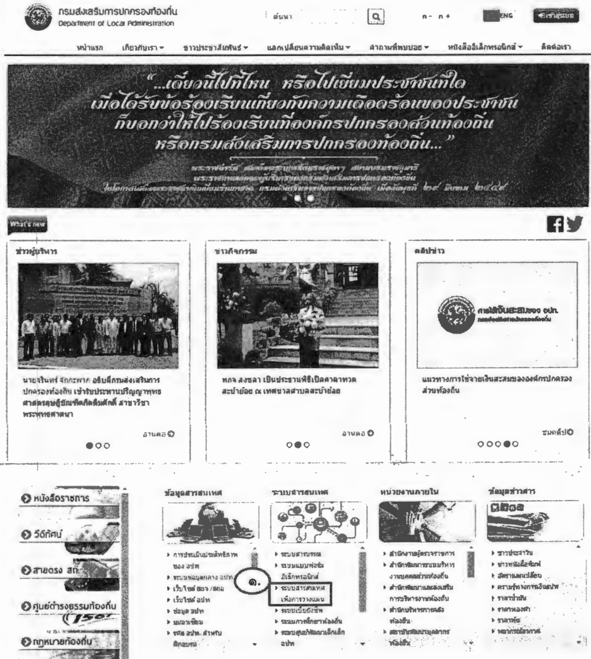
ภาพที่ ๑ เว็บไซต์กรมส่งเสริมการปกครองท้องถิ่น

เปิดโปรแกรม Web Browser (Google Chrome, Firefox) จากนั้นพิมพ์ URL http://www.dla.go.th เพื่อเข้าสู่เว็บไซต์กรมส่งเสริมการปกครองท้องถิ่น แล้วคลิกเลือกเมนู “ระบบสารสนเทศเพื่อการวางแผน” จากหัวข้อ “ระบบสารสนเทศ” ตามภาพที่ ๑