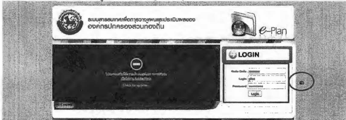
ภาพที่ ๒ หน้าจอเข้าสู่ระบบสารสนเทศเพื่อการวางแผนและประเมินผลของ อปท.