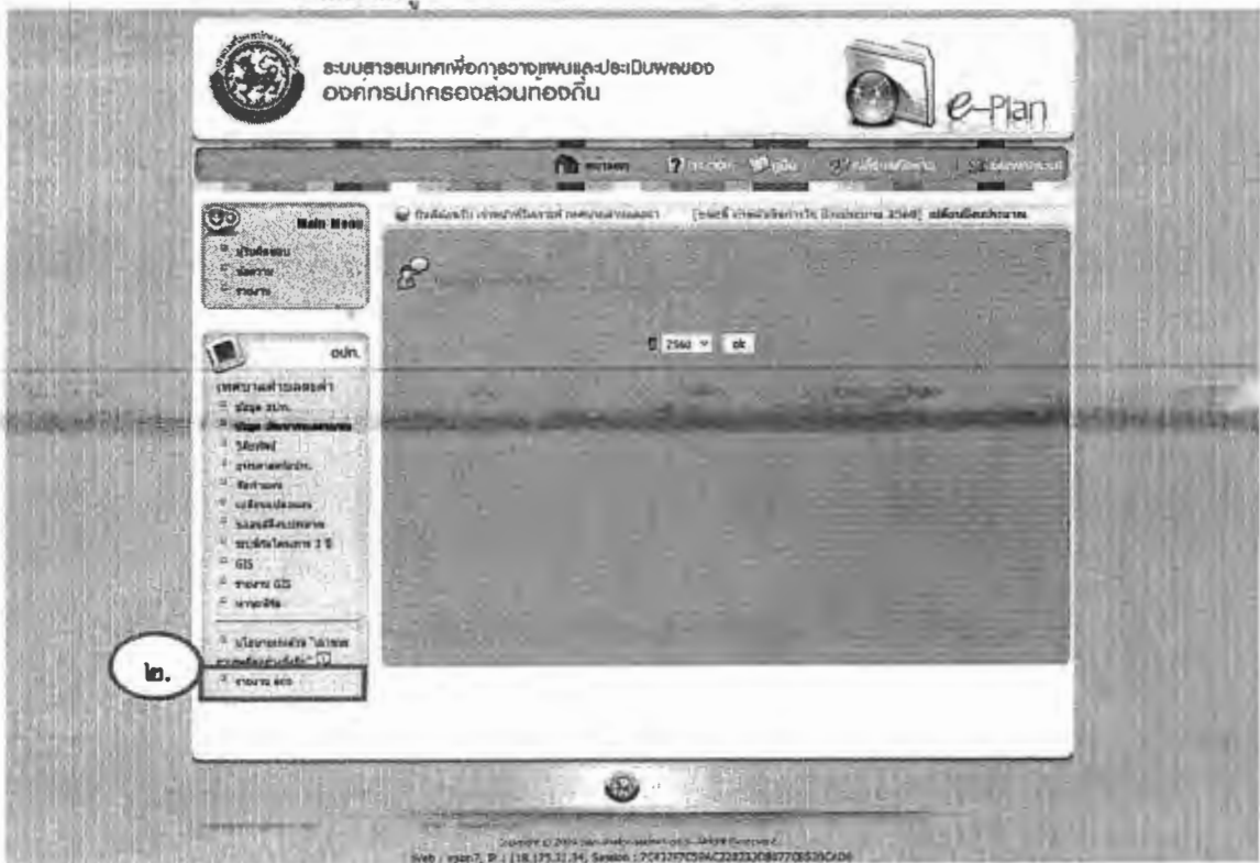
ภาพที่ ๓ หน้าจอระบบสารสนเทศเพื่อการวางแผนและประเมินผลของ อปท.