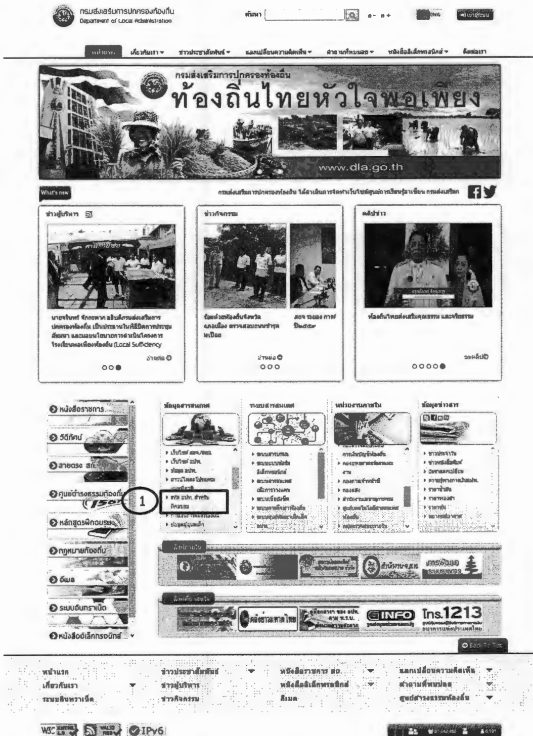
ภาพที่ 1 เว็บไซต์กรมส่งเสริมการปกครองท้องถิ่น

1. เปิดโปรแกรม Web Browser (Google Chrome, Firefox) จากนั้นพิมพ์ URL http://www.dla.go.th เพื่อเข้าสู่เว็บไซต์กรมส่งเสริมการปกครองท้องถิ่น แล้วคลิกเลือกเมนู “รหัส อปท. สำหรับการฝึกอบรม” จากหัวข้อ “ข้อมูลสารสนเทศ” ตามภาพที่ 1