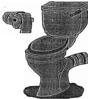
แบบส้วมนั่งราบ