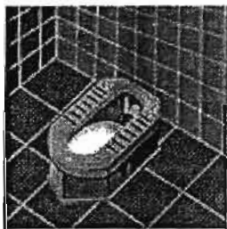
แบบส้วมนั่งยอง