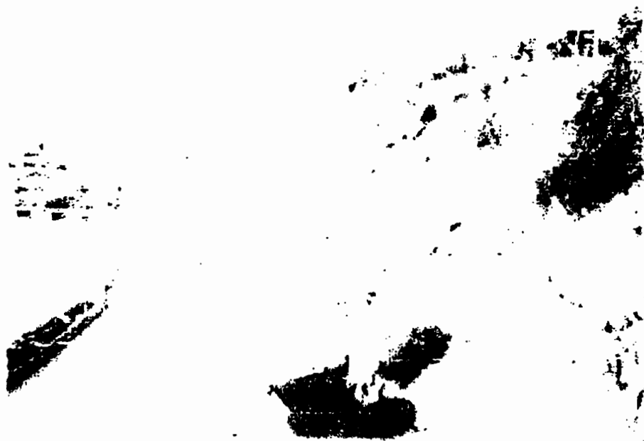
รูปแสดง พื้นที่ริมแม่น้ำมูล เขตเทศบาลวารินชำราบ และบ้านช่องหม้อ อ.วารินชำราบ จ.อุบลราชธานี