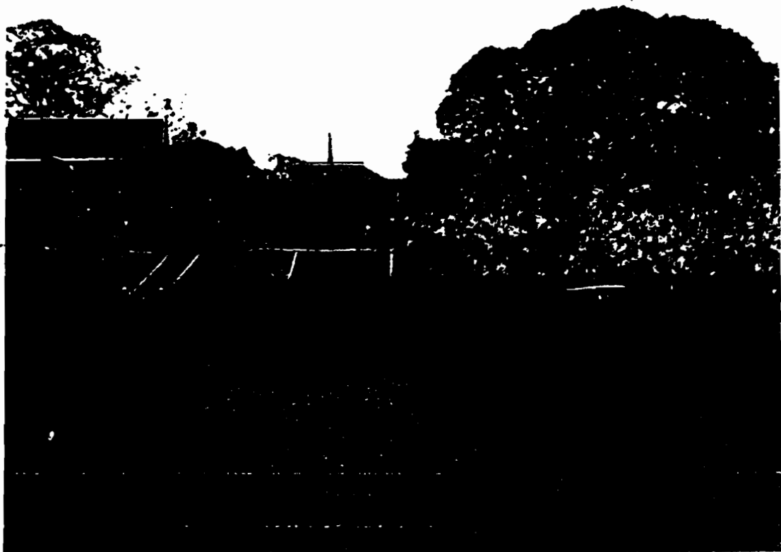
รูปแสดง พื้นที่ริมแม่น้ำป่าสัก บริเวณวัดตะโหนด ต.นครหลวง อ.นครหลวง จ.พระนครศรีอยุธยา