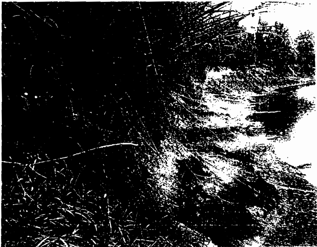
รูปแสดง พื้นที่ริมแม่น้ำสงคราม บ้านไชยบุรี ต.ไชยบุรี อ.ท่าอุเทน จ.นครพนม