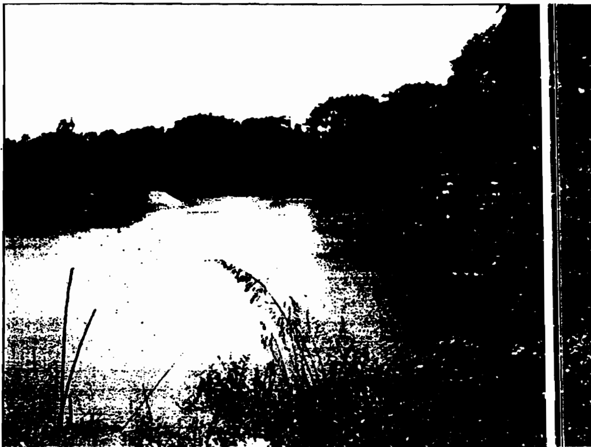
รูปแสดง พื้นที่ริมแม่น้ำวัง บ้านพระธาตุจอมปิง ม.๘ ตำบลนาแก้ว อำเภอเกาะคา จ.ลำปาง