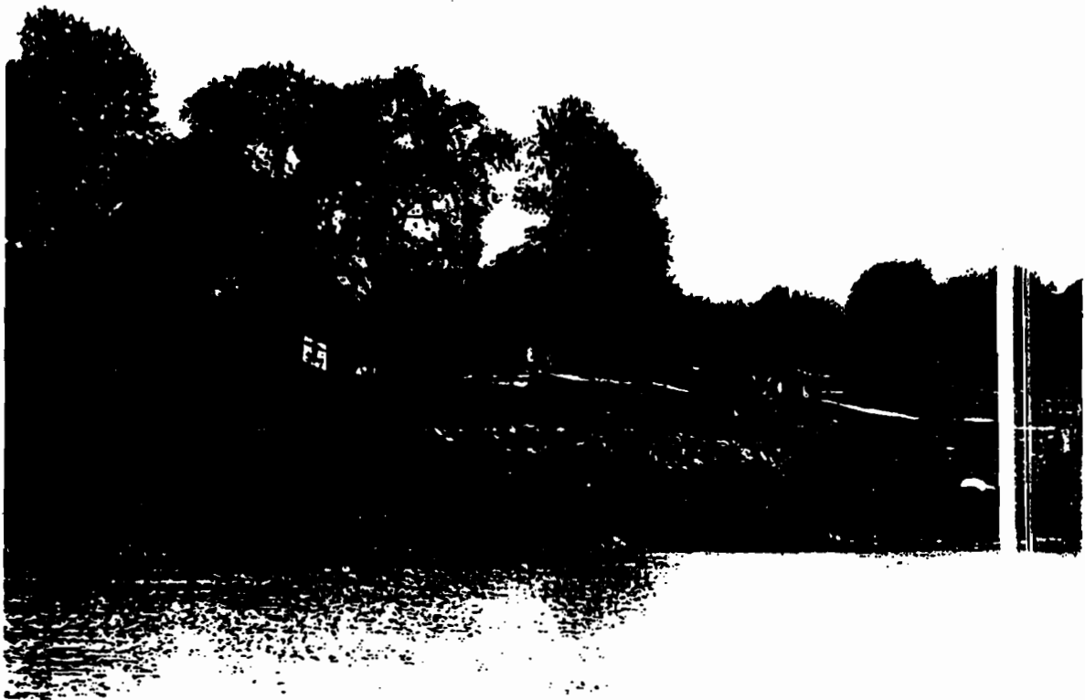
รูปแสดง พื้นที่บริเวณแม่น้ำป่าสัก หมู่ที่ ๑(บ้านท่าแห่) ต.ท่าเจ้าสนุก อ.ท่าเรือ จ.พระนครศรีอยุธยา