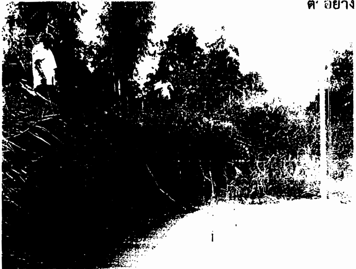
รูปแสดง พื้นที่ริมแม่น้ำเจ้าพระยา หมู่ที่ ๑ ต.ทางช้าง อ.บางบาล จ.พระนครศรีอยุธยา