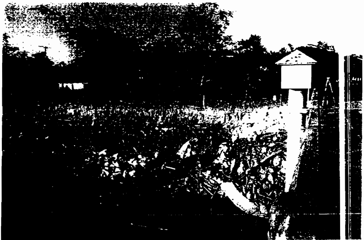
รูปแสดง พื้นที่บริเวณแม่น้ำลี้ ต.เหล่ายาว และต.ศรีเตี้ย อำเภอบ้านไผ่ จังหวัดลำพูน