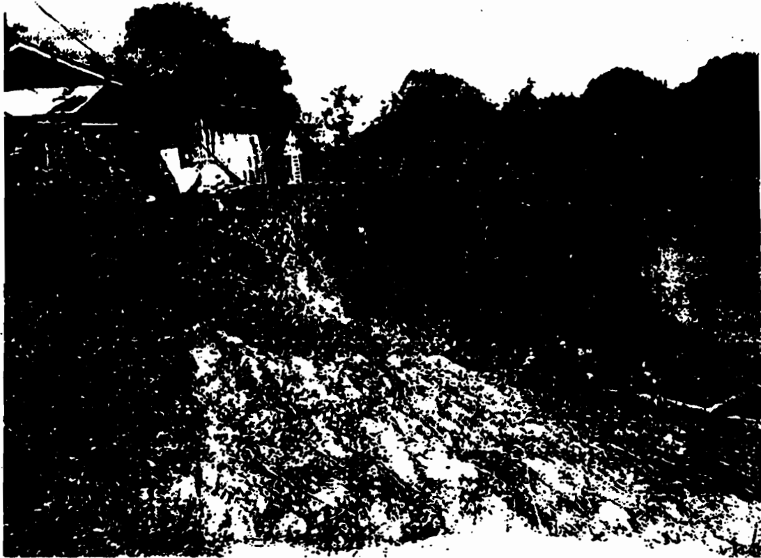
รูปแสดง พื้นที่บริเวณแม่น้ำยม บริเวณวัดแพร่แสงเทียน หมู่ที่ ๑ ตำบลป่าแมต อำเภอเมือง จังหวัดแพร่ ความยาว ๑๘๐ เมตร